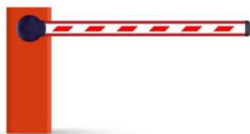
Na výjazdovej rampe NON-STOP